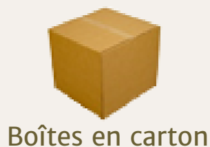
Boîtes en carton